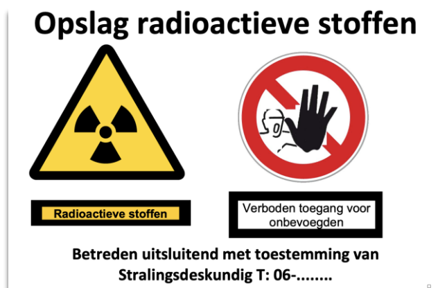
Figuur 4. Voorbeeld markering afgescheiden deel van de locatie

Onderstaand is een voorbeeld opgenomen van een markering voor een afgescheiden deel van de locatie: